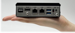
小型インダストリアルPC